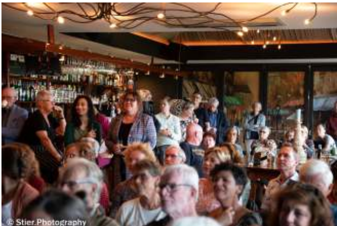
De druk bezochte bijeenkomst