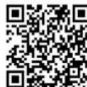
QR code DWO website

De meeste mensen willen best helpen, maar weten niet hoe. Daar helpen we graag bij door middel van deze campagne van Samen dementievriendelijk. Heb jij de online training op www.samendementievriendelijk.nl al gedaan?