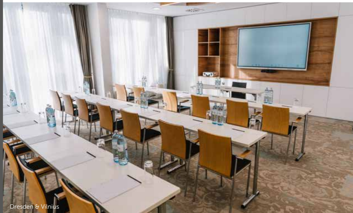
Dresden & Vilnius

Personen können an dem exklusiven Meeting mit höchstem Tagungskomfort teilnehmen. (Seminarraum Alte Pfarrei)