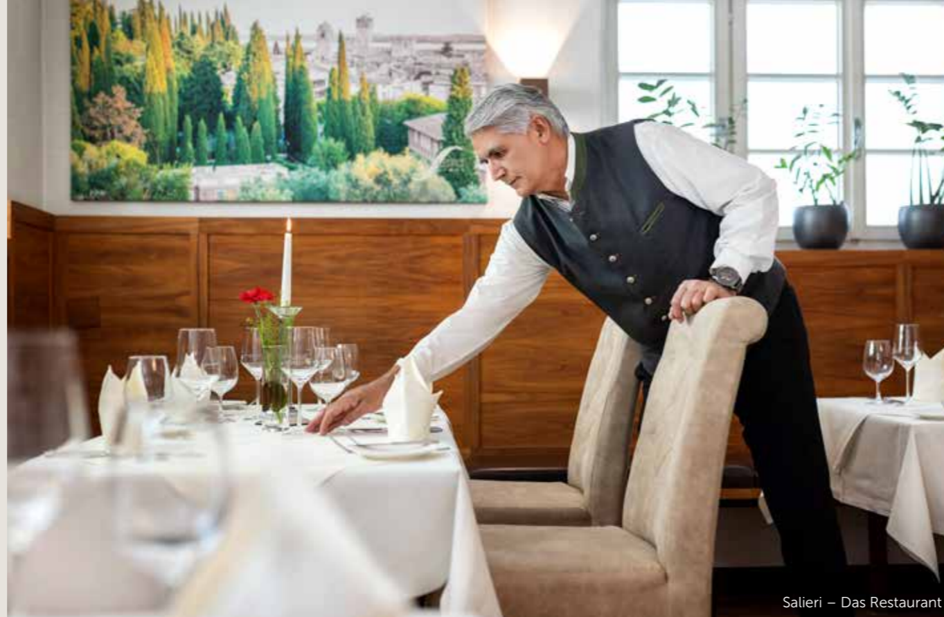
Salieri – Das Restaurant

Bei Schönwetter locken unsere zwei Terrassen im Hotelpark ins Freie – umgeben von grüner Natur und einer 400 Jahre alten Linde, lässt es sich hier entspannt genießen. Auch Stehempfänge, Grill-Abende oder ein Punsch-Umtrunk im Winter finden hier den perfekten Rahmen.