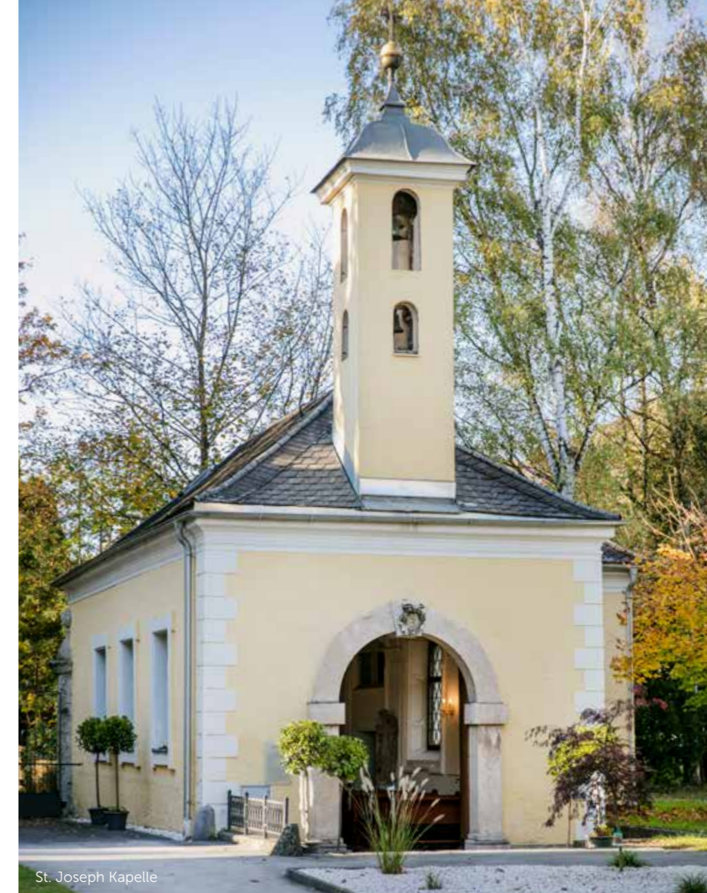
St. Joseph Kapelle

Morgens, mittags, oder abends – mit vollem Genuss!