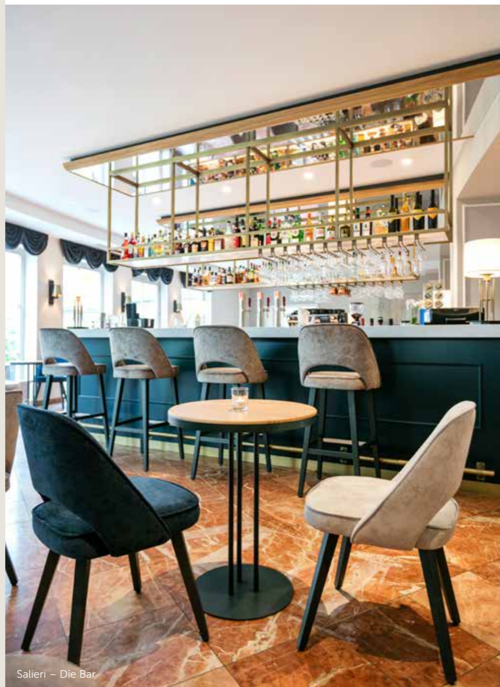
Salieri – Die Bar

Morgens, mittags, oder abends – mit vollem Genuss!