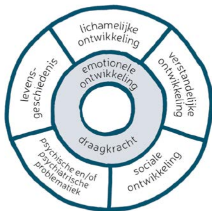
De hermeneutische cirkel

op Bosch en Suykerbuyk. Deze methode helpt een inschatting te maken van de cliënt en zijn functioneren op alle terreinen van zijn leven. Bij de dagbesteding wordt bijvoorbeeld gekeken of de activiteiten aansluiten bij wat de cliënt op dat moment aankan, waar hij/zij trots op kan zijn en waar hij/zij plezier aan beleeft. Onze begeleiding sluit aan bij wat cliënten belangrijk en waardevol vinden. Zowel bij wat zij zelf kunnen en willen, als bij wat zij met ondersteuning van het netwerk (verwanten, vrienden, vrijwilligers, kerkgenoten of buurt) zelf kunnen organiseren. Samen kijken we naar de verantwoordelijkheid die de cliënt zelf kan dragen en wie het beste op welke manier kan ondersteunen.